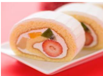
花月堂 プランタンヌーボー