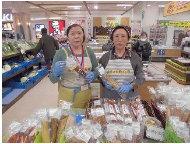
ふるさと安心畑 いぶりがっこ