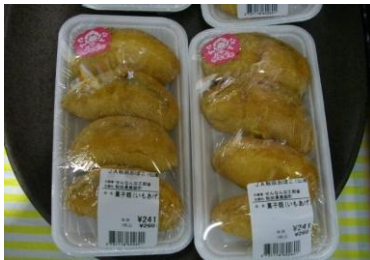
仙南加工部会 いもあげ