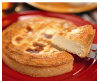
トロイカバークドチーズケーキ