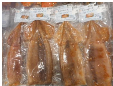
ぬか漬け専門店「高山食品」 鶏もも糠漬け・いか糠漬け