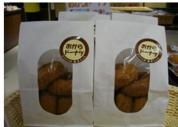
湧子ちゃん おからドーナツ