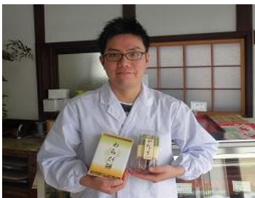
御菓子司「わかさ」 がんじき・莓大福