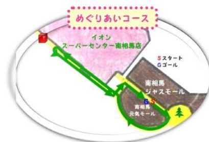
めぐりあいコース