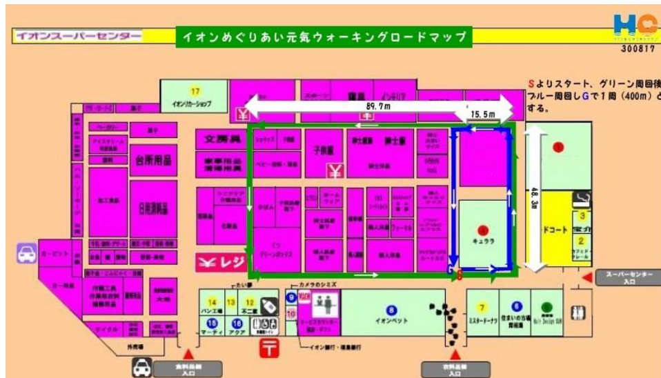
イオンスーパーセンター南相馬店店内ウォーキングコース